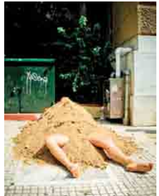
«Τι έγινε, ρε παιδιά, πέθανε;» Ηλικιωμένος περαστικός

Κείμενο-φωτογραφίες: Σταύρος Πετρόπουλος